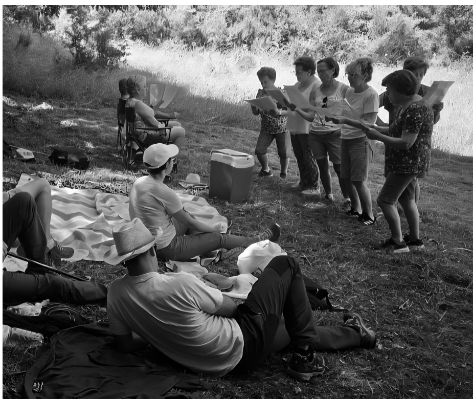
Recitando las coplas en la Fiesta de los gamones.

La fiesta comienza con la subida conjunta al Collado del Baile desde las tres localidades. A las 12 de la mañana, parten de sus pueblos de origen en pequeños grupos hasta confluir en el lugar acordado. Después de los saludos de rigor entre los vecinos, se suceden las historias y anécdotas y suena la música tradicional con pandereta y tambor. Y en este tipo de eventos no puede faltar una comida campestre, repartida en corros de vecinos, familiares y amigos, sentados a la sombra de los árboles, en un día que destacó por el excesivo calor reinante, y que llevó a la Junta de Castilla y León a declarar el Estado de Alerta, que estará vigente hasta el próximo 1 de julio.