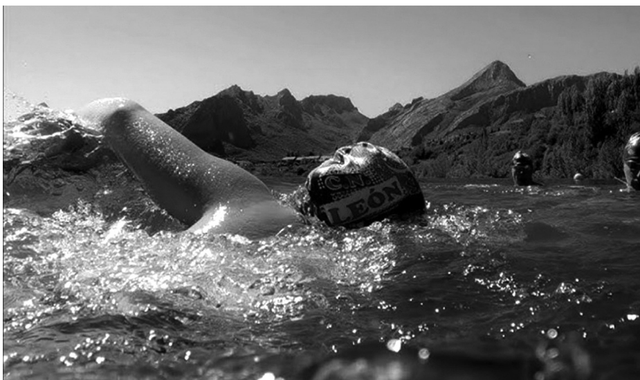
Un participante en una edición anterior.

El evento cuenta con el respaldo del Ayuntamiento de Riaño y la colaboración de numerosas empresas locales, un apoyo fundamental para el desarrollo de una actividad que no solo impulsa el deporte, sino también el turismo y la economía de la comarca. La Travesía a Nado del Pantano de