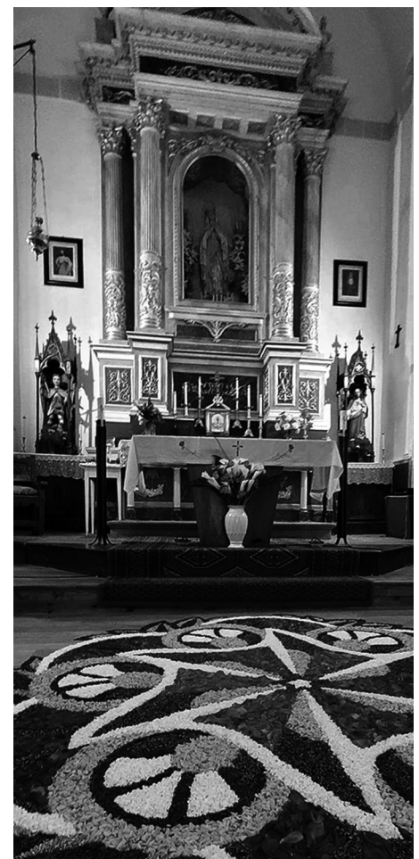
Imágen de la iglesia durante la edición del año pasado

Desde la Revista Comarcal Montaña de Riaño apoyamos decididamente estos actos que entroncan con la más profunda tradición religiosa y se convierten, por derecho propio, en verdaderas atracciones locales para los habitantes de la montaña.