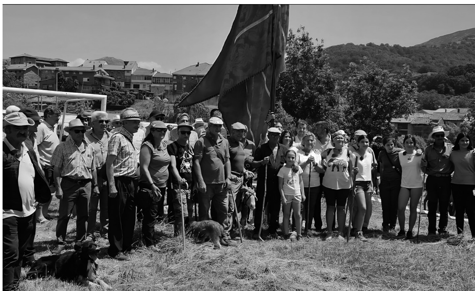
Los pastores y su familia recibidos por las autoridades locales.

A continuación, el Concurso de Siega con guadaña volvió a coronar