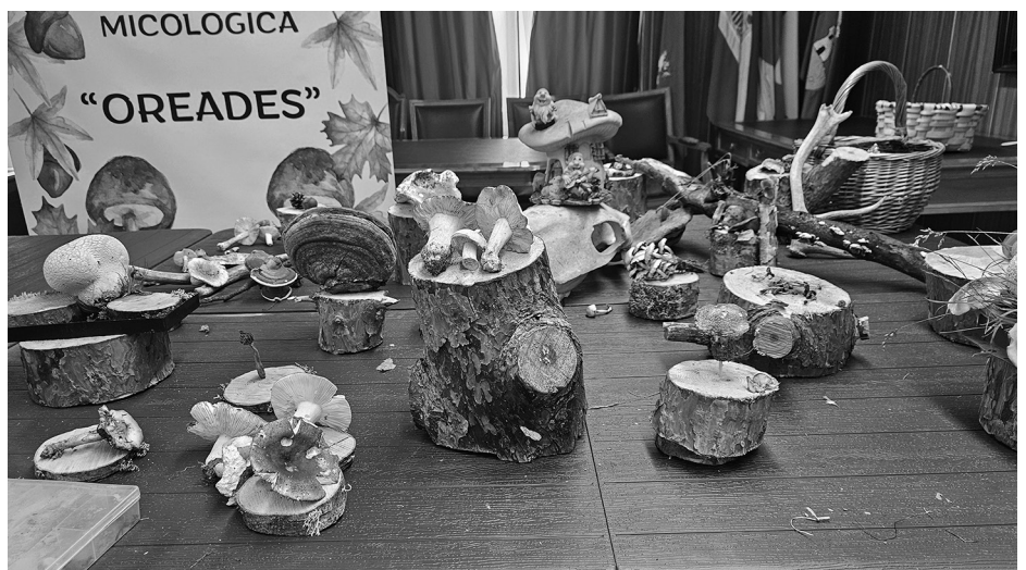
Exposición de las especies encontradas.