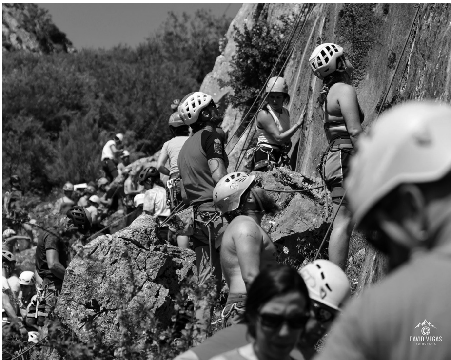
Escalando en Peña Grande.