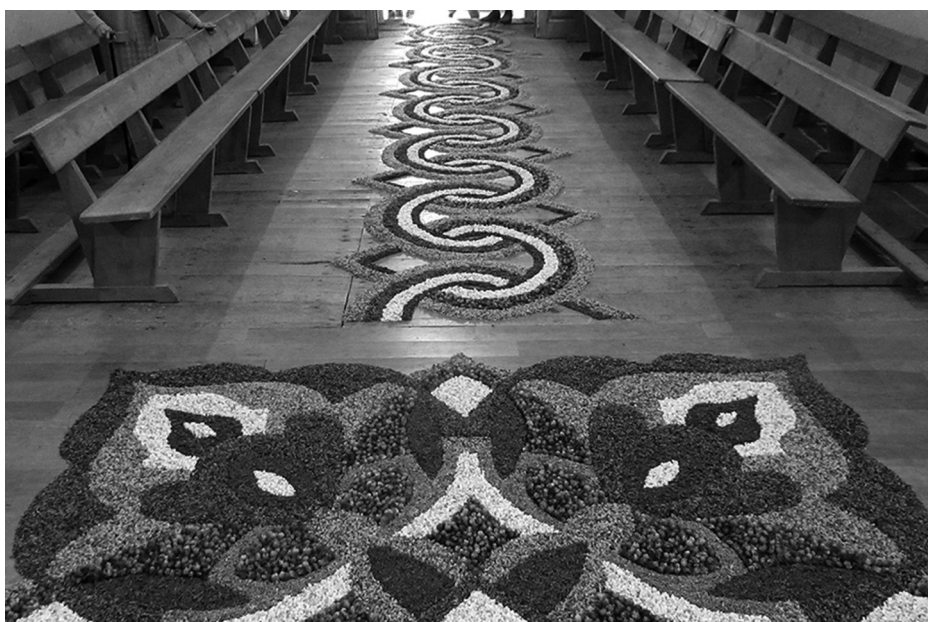
La alfombra floral de este año 2025.

Lejos de perder fuerza con el paso del tiempo, esta tradición va cobrando carácter propio y atrae cada año a más visitantes, convirtiéndose en un verdadero acontecimiento que trasciende lo meramente religioso. Durante la jornada, la calle que llega desde la iglesia parroquial hasta la plaza se cubre de pétalos recordando una tradición que se pierde en la noche de los tiempos. En la misma plaza, frente a un pe-