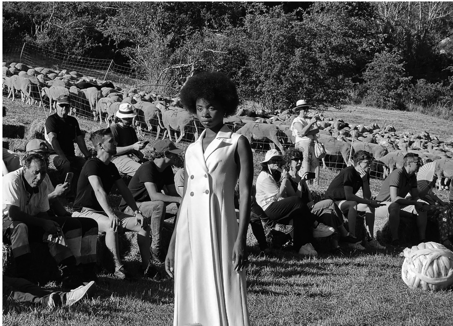
Desfile de moda en el Wool Fest con modelos profesionales.

“Estoy supercontento. Nos ha costado mucho y aún tenemos mucho que aprender, que modificar. Pero hay algo con lo que no vamos a poder; y es la climatología. Hoy nos ha pegado el sol demasiado fuerte, pero no podemos hacerlo en otra fecha si queremos contar con las ovejitas. El resultado para mí, ha sido superpositivo y creo