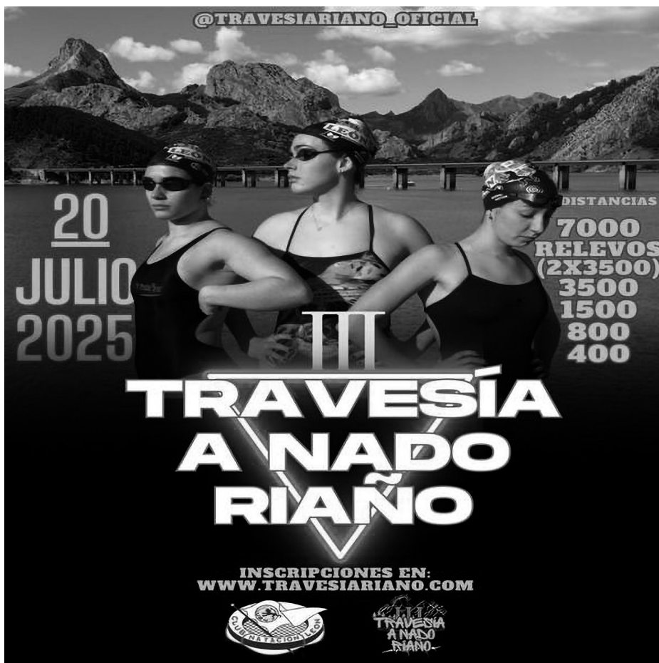
Cartel oficial de la prueba.

deportiva en aguas abiertas y, con su presencia, apoyaran y aplaudieran el gran esfuerzo que supone para el Club Natación León presentar en Riaño una prueba de estas características.