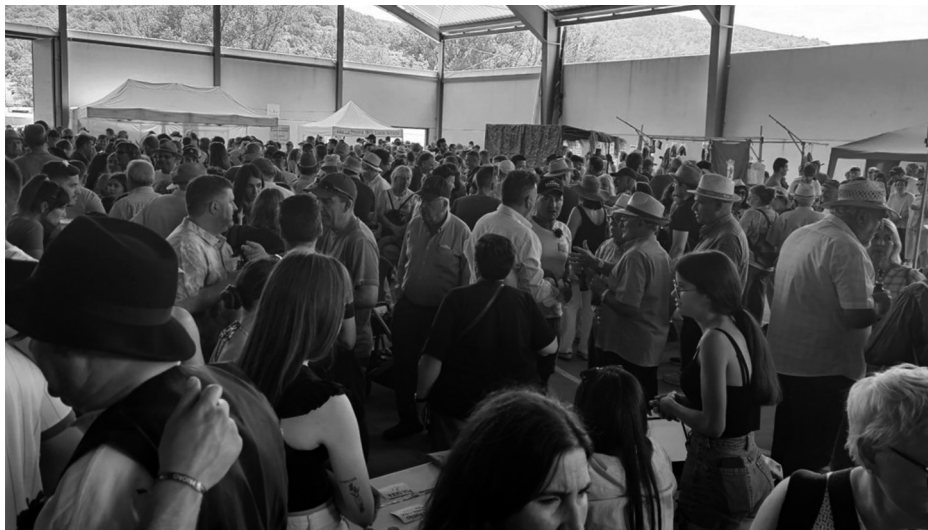
Interior del polideportivo durante la fiesta.

El festín estaba compuesto por los platos típicos de pastores: caldereta de cordero y chanfaina, servida